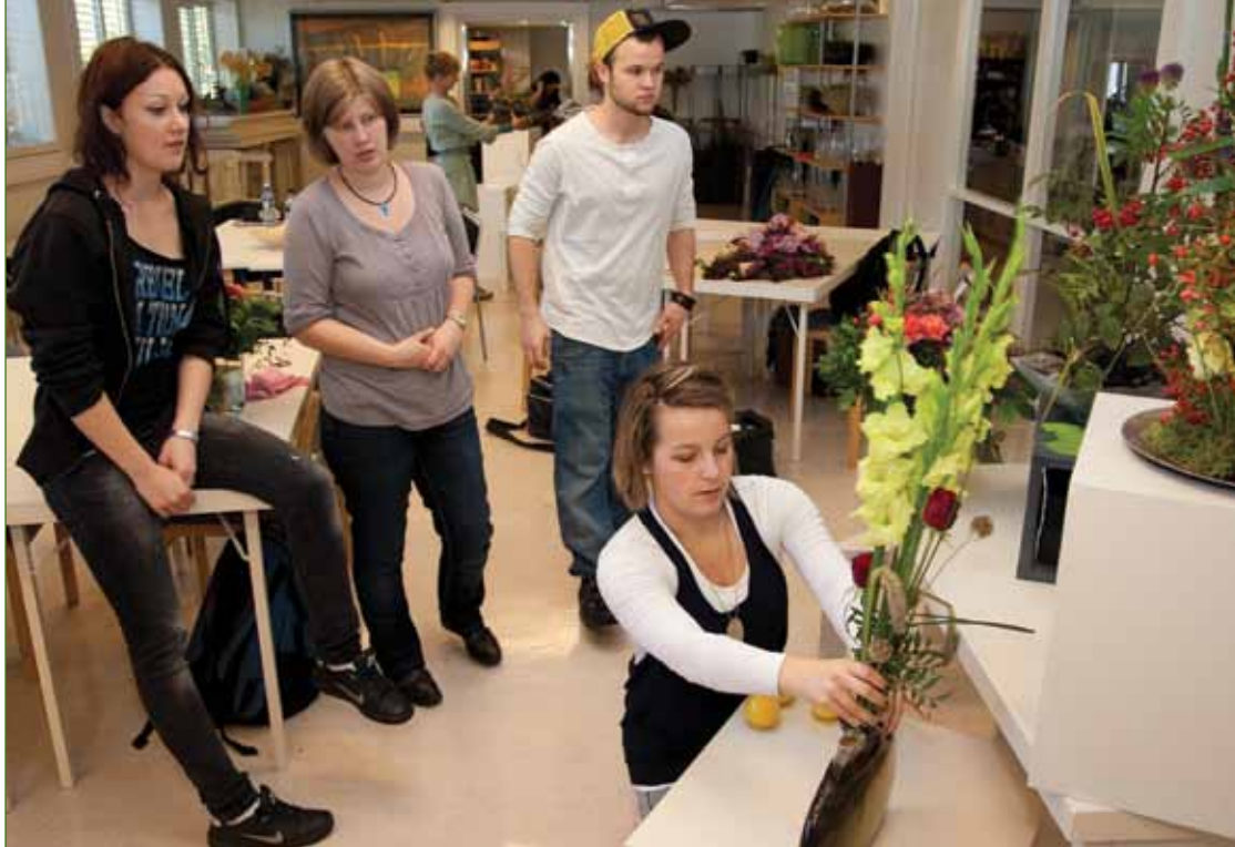
Utstilling og presentasjon er en viktig del av blomsterdekoratørfaget. Denne gruppa diskuterer sitt arbeid under en samling hos BLOK.

Om det kommer inn en kunde i sorg for å bestille sorgarbeid, vil en person uten innsikt i verste fall kunne ødelegge kundeforholdet. Vi møter kundene i alle livssituasjoner fra de gladeste til de sørgeligste. Mange kunder vil også gjerne prate om sin situasjon. Det hører med til faget å kunne takle slikt. Ofte kan det være minst like viktig å være god på kundekommunikasjon som å være en flink blomsterdekoratør. Fagkunnskap er selvsagt en basis for å kunne gi råd og veiledning, men det hjelper ikke om de er aldri så faglig dyktig om du ikke kan kommunisere med kunden, påpeker Aanes.